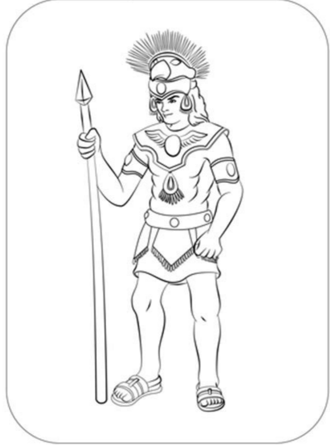
A Mayan warrior